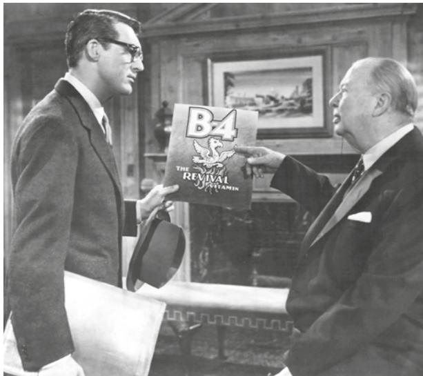
Cary Grant et Charles Coburn dans Chérie, je me sens rajeunir (1952) de Howard Hawks.