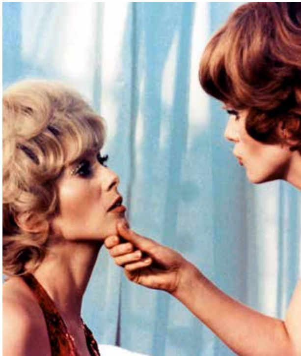
Catherine Deneuve et Françoise Dorléac dans Les Demoiselles de Rochefort (1966) de Jacques Demy.